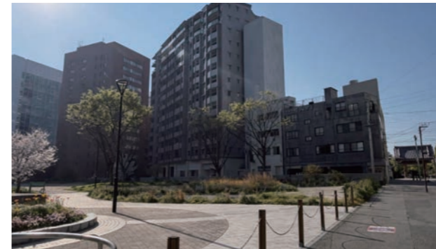
現在の出来町公園の様子