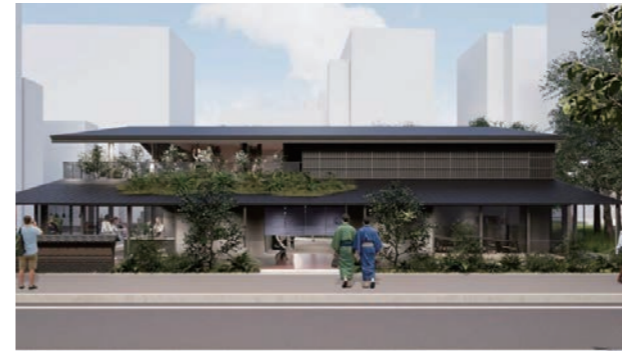
建物外観（承天寺通りから）