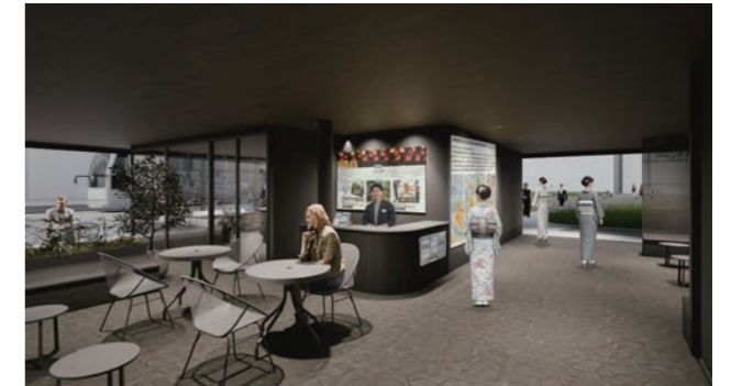
1階 休憩案内スペース