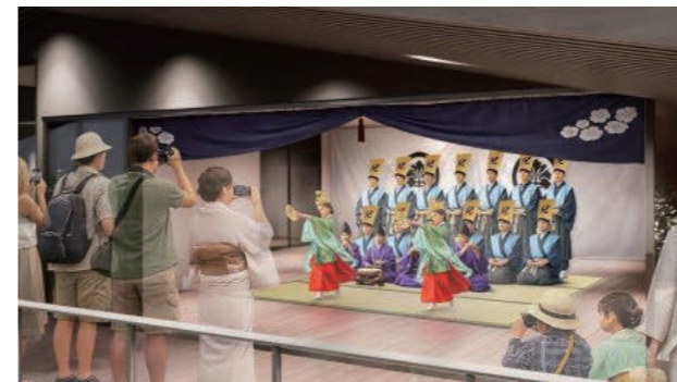
多目的スペース（稚児舞）